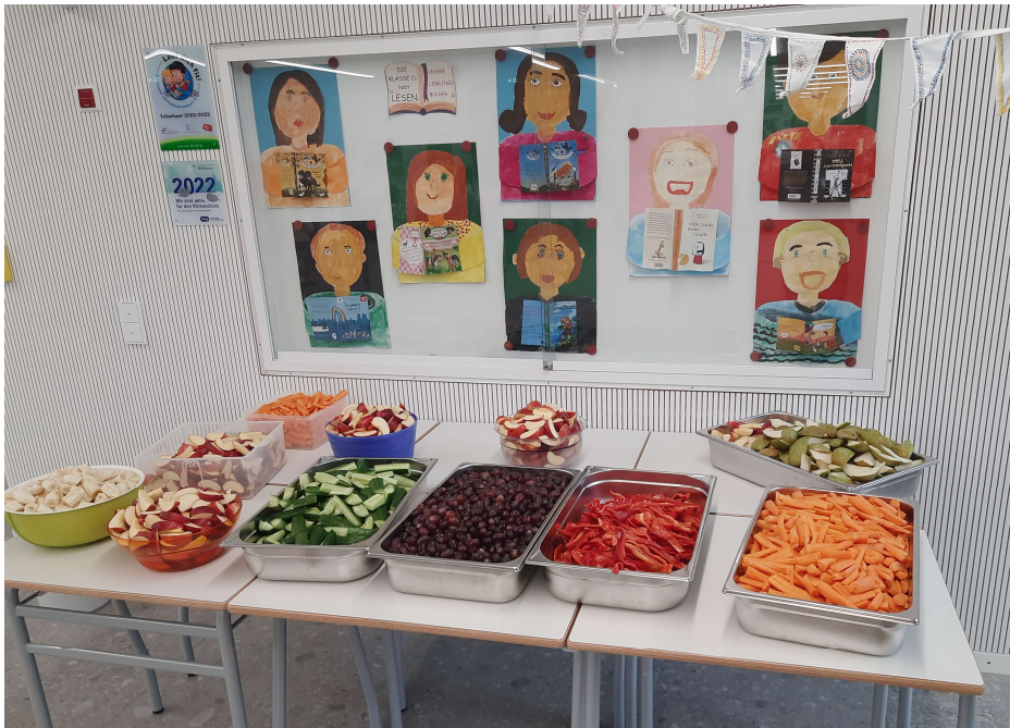
Gesunder Snack vom Elternbeirat

Am Mittwoch spendierte der Elternbeirat ein gesundes Frühstück und half uns das Obst und Gemüse für die erste Pause vorzubereiten. So konnten sich alle Schülerinnen und Schüler einen gesunden Snack mit in die Pause nehmen: