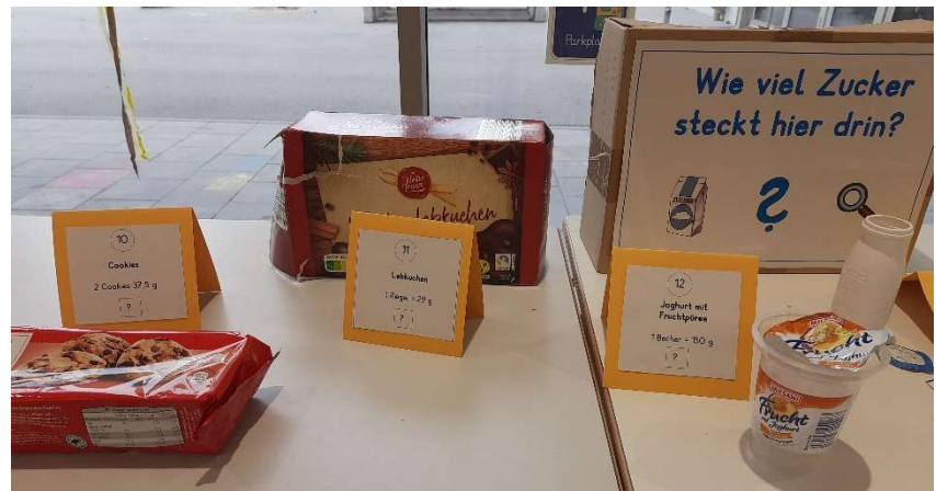
Zuckerausstellung und Schulhausrallye

Teil der Rallye war auch eine kleine Zuckerausstellung in der Aula. Einige bei Kindern beliebte Produkte, wie z. B. Actimel, Nutella, Cookies, usw. wurden dort mit abgeklebter Nährwertabelle ausgestellt. Die Schüler und Schülerinnen sollten erraten wie viele Würfel Zucker die einzelnen Produkte enthalten.