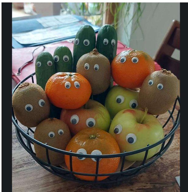
Hauptgewinn der Schulhausrallye

Am Ende der Rallye wurden alle Antwortblätter in eine Losbox geworfen und am Freitag die glücklichen Gewinner ausgelost. Der Preis sah dann so aus: